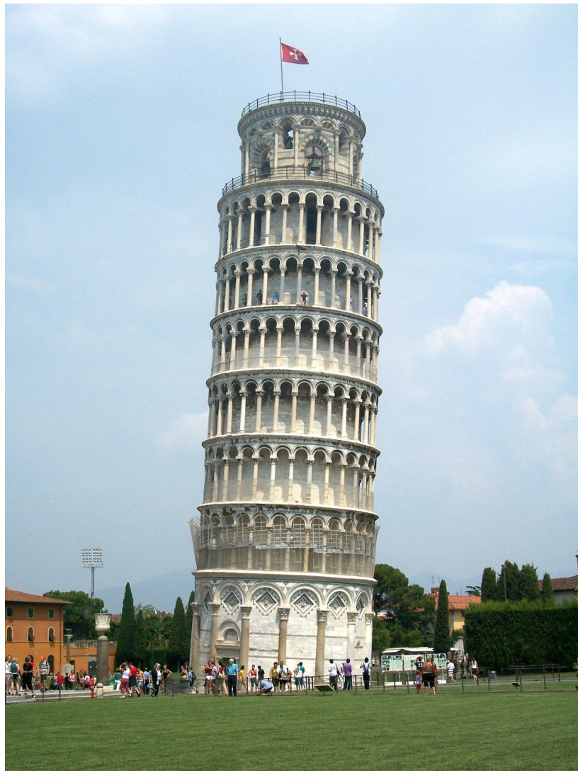
Abbildung 4: Turm von Pisa

„Nehmt einfach die Fähre um 19:00 Uhr. Die fährt nach Griechenland und außerdem werdet ihr so wohl am einfachsten dort hingelangen. Hier, Ihr könnt jeder noch eine große Portion Gelato haben, um euren langen Weg etwas süßser zu gestalten.“ Die Zwerge bedanken sich, warten bis es 19:00 Uhr ist, und gehen, als es endlich soweit ist und sie sich von Pinocchio verabschiedet haben, auf die Fähre. Voller Hoffnung machen sie sich auf den Weg nach Griechenland und ab in das nächste Abenteuer.