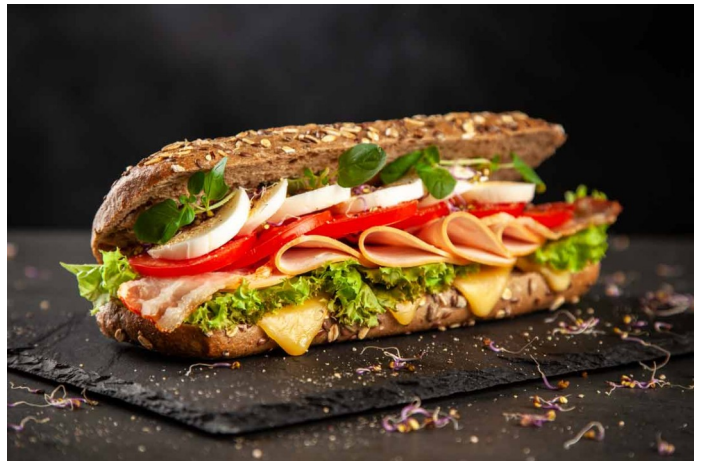
Abbildung 2: Belegtes Baguette

„Oh, hier riecht es aber lecker!“ „Vielen Dank, das sind meine frisch zubereiteten Bocadillos, die ich nach meinem Geheimrezept kreiert habe. Wollt ihr mal welche probieren?“. Señorita Dora bietet ihnen ein paar ihrer spanischen Spezialitäten an, was gerade genau das Richtige für die 7 Zwerge ist. Die Zwerge bedienen sich und fragen Dora, ob sie weiß, wo Schneewittchen ist. Dora weiß es zwar nicht, sie leitet die Zwerge aber an einen anderen Stand, wo Abuela María ihnen weiterhelfen könnte. Erwartungsvoll begeben sich die 7 Zwerge zu Abuela María, welche ihren Stand am Ende des Marktplatzes hat. Es ist sehr voll auf dem Marktplatz und den Zwergen fällt auf, dass viele mit einer skelettartigen Gesichtsbemalung rumlaufen. Verwundert begeben sie sich vor den Stand von Abuela María.