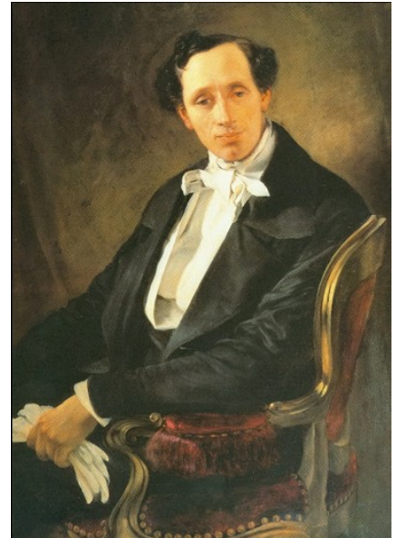
Abbildung 10: Hans Christian Andersen