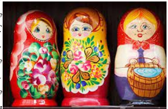
Abbildung 8: Babuschka

bemerkt dieser, dass die Zwerge sich bereits auf den Weg gemacht haben. Plötzlich macht sich der Pastor schreckliche Sorgen über seine kleinen neuen Freunde. „Oh Nein, die Armen