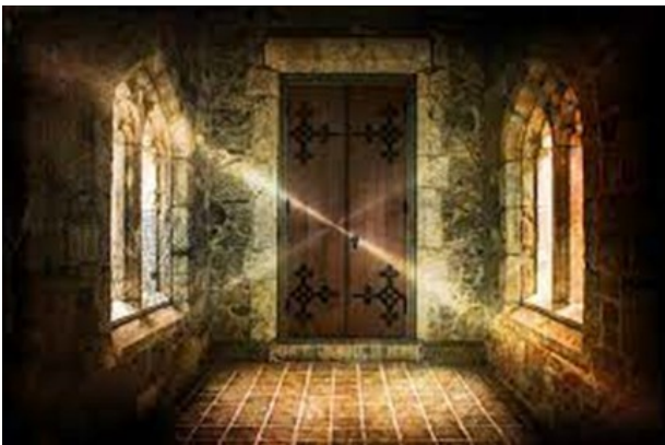
Abbildung 6: geheimnisvolle Tür