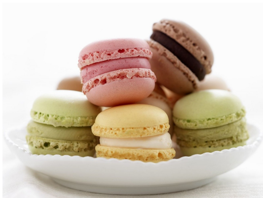
Abbildung 1: Bunte Macarons