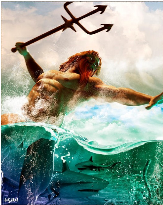
Abbildung 5: Poseidon

Orientierungslos fangen die Zwerge an durch einen düsteren Wald zu irren in der Hoffnung, dass sie endlich auf Schneewittchen stoßen. Weit und breit ist keine Seele zu sehen, doch spüren die Zwerge dringliche Blicke auf ihnen ruhen. Uprplötzlich sehen sie ein gleißendes Licht rasch auf sie zukommen. Verdattert blinzeln sie, um genauer zu sehen, wer vor ihnen steht.